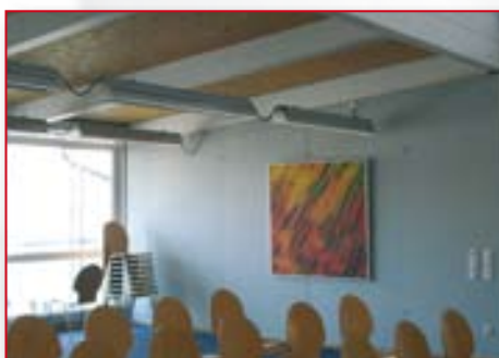
Akustikbilddruck / acoustic picture print